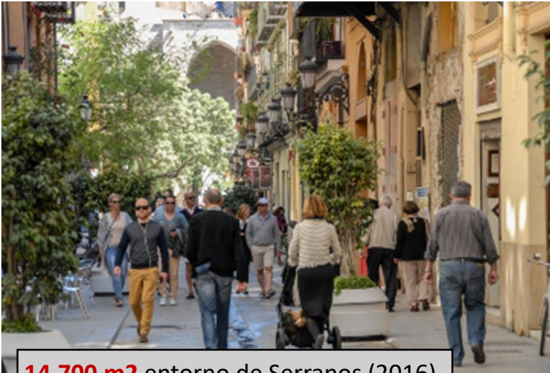
14.700 m 2 entorno de Serranos (2016)