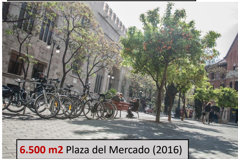
6.500 m 2 Plaza del Mercado (2016)

De 2015 a 2021 se han recuperado más de 60.000 m 2 de espacio peatonal