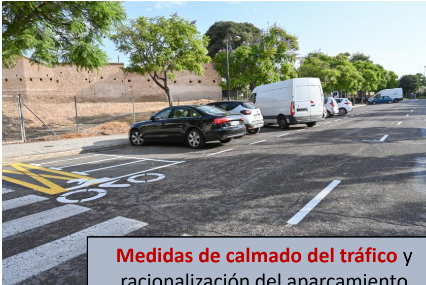
Medidas de calmad del tráfico y racionalización del aparcamiento