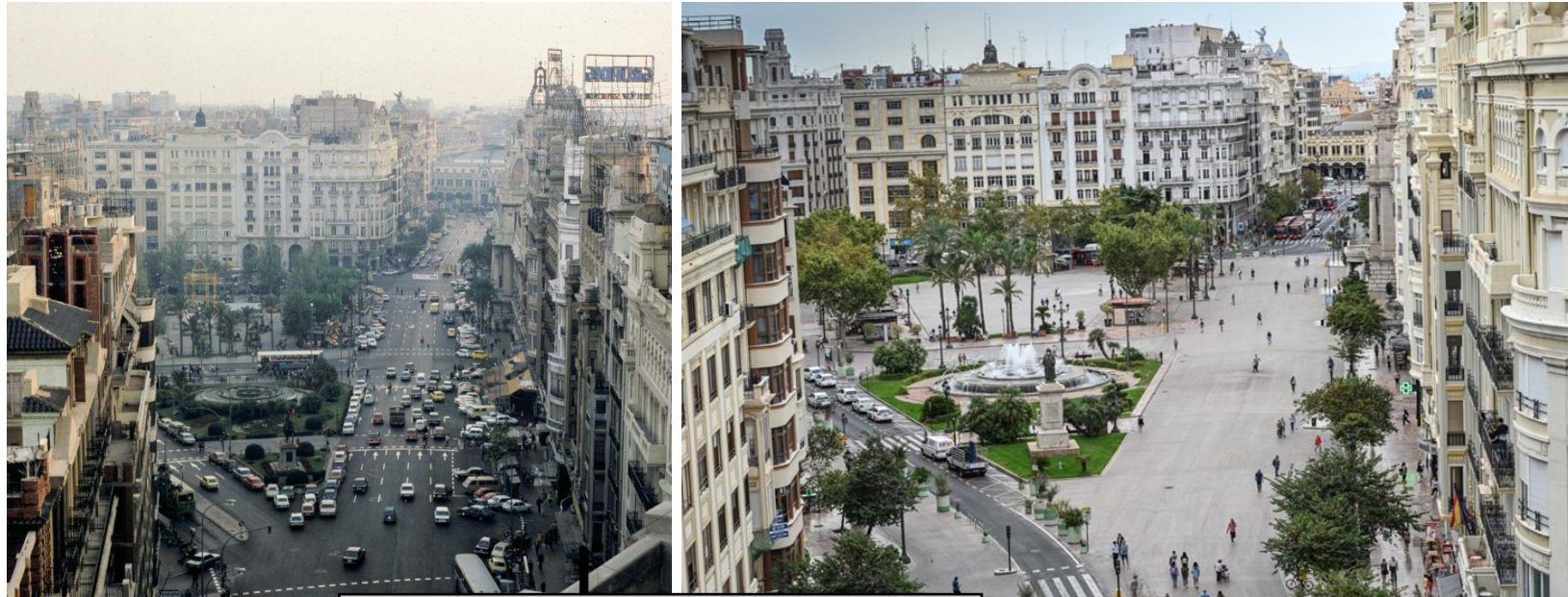
12.000 m 2 Plaza del Ayuntamiento (2020)

De 2015 a 2021 se han recuperado más de 60.000 m 2 de espacio peatonal